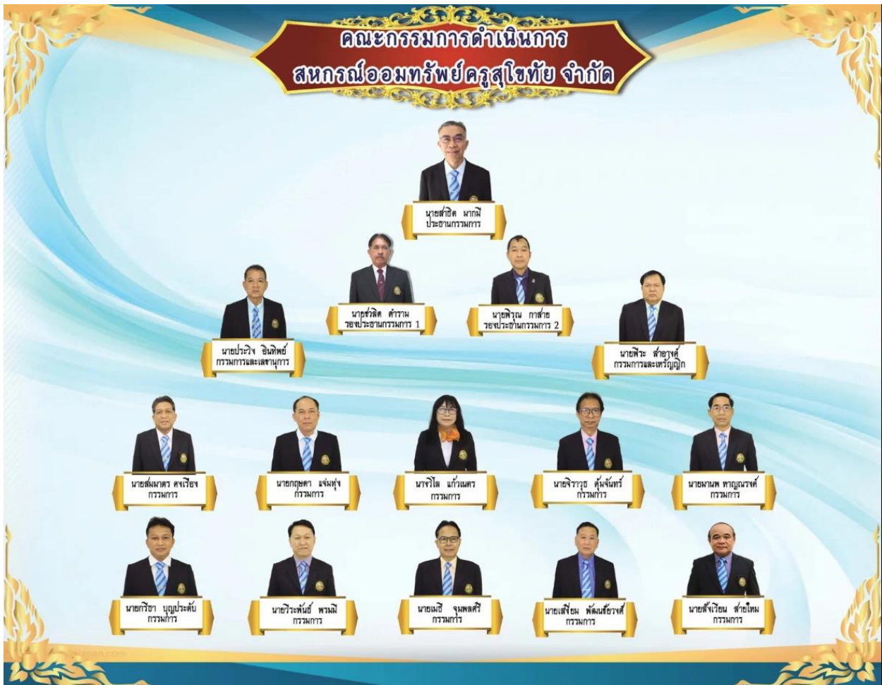
คณะกรรมการดำเนินการสหกรณ์ จำนวน 15 คน

ปี พ.ศ.2568 สหกรณ์ออมทรัพย์ครูสุโขทัย จำกัด มีบุคลากรฝ่ายต่าง ๆ ประกอบด้วย