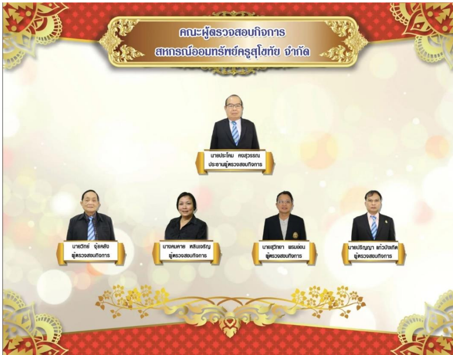
ผู้ทรงสอบกิจการสหกรณ์ จำนวน 5 คน